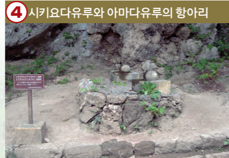
4 시키요다유루와 아마다유루의 향아리

2 개의 종유석에서 떨어지는 { 성수 } 를 받기 위해 2 개의 향아리가 설치되어 있습니다.