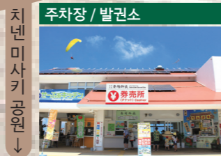
주차장 / 발권소