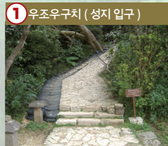
1 우조우구치 ( 성지 입구 )

우조우구치를 올라가 왼쪽에 보이는 첫 번째 기도소입니다. 넓은 방이나 제일 좋은 방을 뜻하고 바위 앞에는 돌판이 깔린 기도소 (우나아) 가 있습니다.